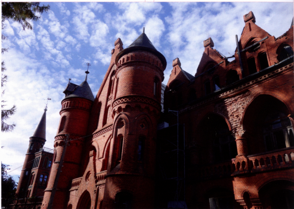
1 Dr. Hermann Brehmer Sanatorium, Sokołowsko